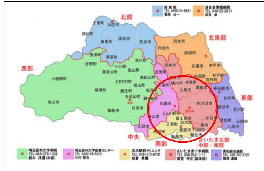
埼玉県内ブロック分け図