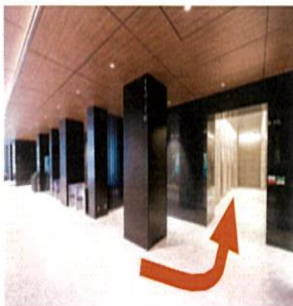
③ オフィスエントランスホールを突きあたりまで進み、 【A 低層エレベーター】で3Fまでお越しく下さい。