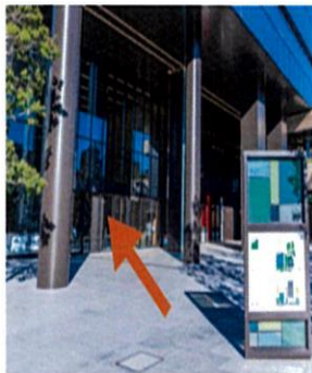
① YOTSUYA TOWER 1F エントランス 正面入口よりビル内へ入ります。