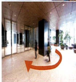
② エスカレーターで2Fまで上がり、すぐ右に曲がると オフィスエントランスホールがございます。 自動扉を開き、道なりに進みます。